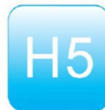
H5 GSM Alarm System